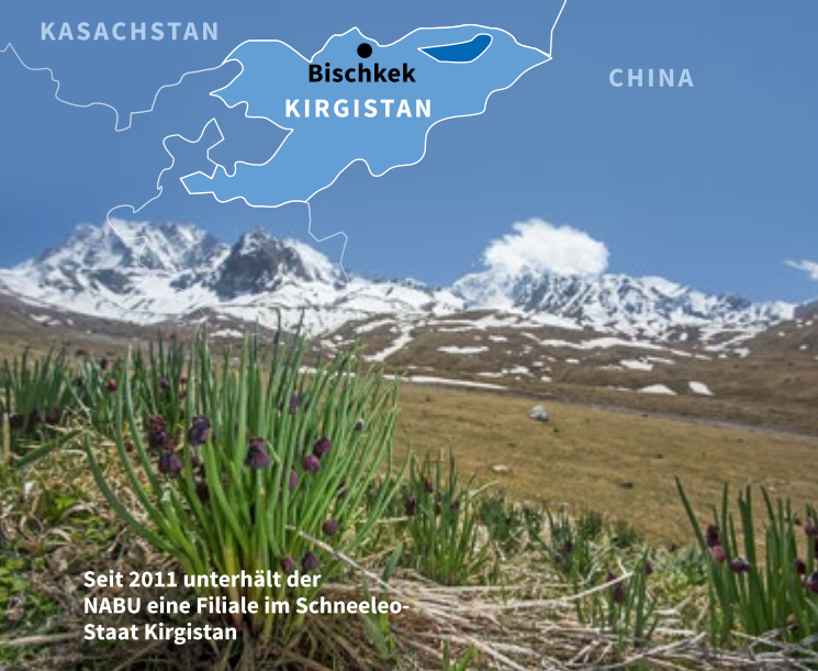
Seit 2011 unterhält der NABU eine Filiale im Schneeleo-Staat Kirgistan