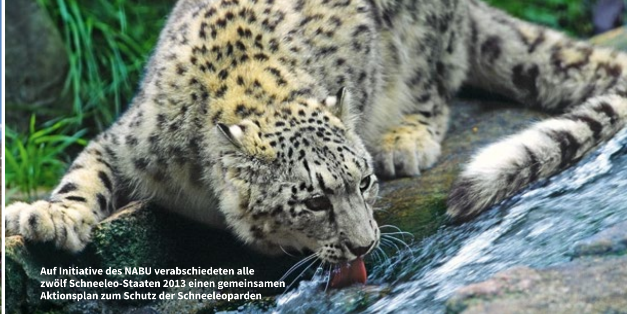
Auf Initiative des NABU verabschiedeten alle zwölf Schneeleo-Staaten 2013 einen gemeinsamen Aktionsplan zum Schutz der Schneeleoparden